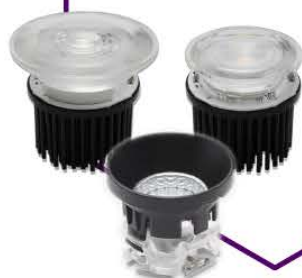
REFLECTORES Y ÓPTICAS