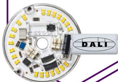
MÓDULOS LED AC