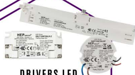
DRIVERS LED Y FUENTES DE ALIMENTACIÓN

Nuestra alianza con los principales fabricantes y proveedores nos permite garantizar precios competitivos, alta calidad y cumplimiento de todas las normativas vigentes.