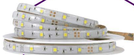
TIRAS FLEXIBLES Y PERFILES