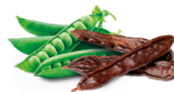
VEGETAIS PROTEÍNAS E VITAMINAS VEGETAIS