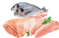
CARNE E PEIXE FRESCOS PROTEÍNAS DE ELEVADO VALOR BIOLÓGICO