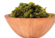
ALGAS MARINHAS MINERAIS ORGÂNICOS NATURAIS

Na nossa composição indicamos todos os ingredientes utilizados e destacamos, de forma clara e compreensível, quais destes ingredientes são naturais. Com total fiabilidade e transparência.