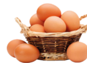
OVOS PROTEÍNAS DE ELEVADO VALOR BIOLÓGICO