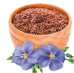
SEMENTES DE LINHAÇA CUIDADO PELE E PELO. ÔMEGA 3-6