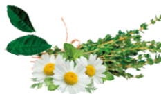
PLANTAS AROMÁTICAS BEM-ESTAR DIGESTIVO