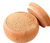
LEVEDURA DE CERVEJA PROTEÇÃO SISTEMA IMUNITÁRIO